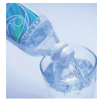
D コース SAMPLE