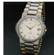
C コース SAMPLE