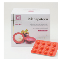
A コース SAMPLE