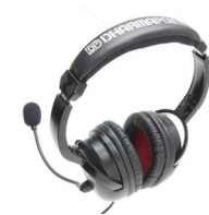
B コース SAMPLE