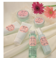
E コース SAMPLE